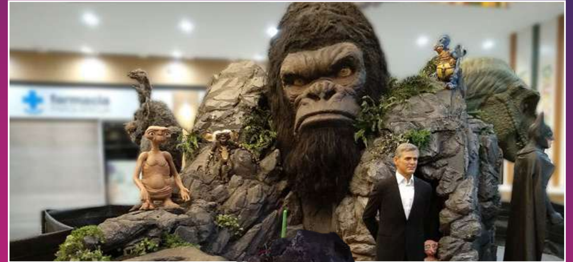
“Un gigantesco King Kong de 5 metros de altura”