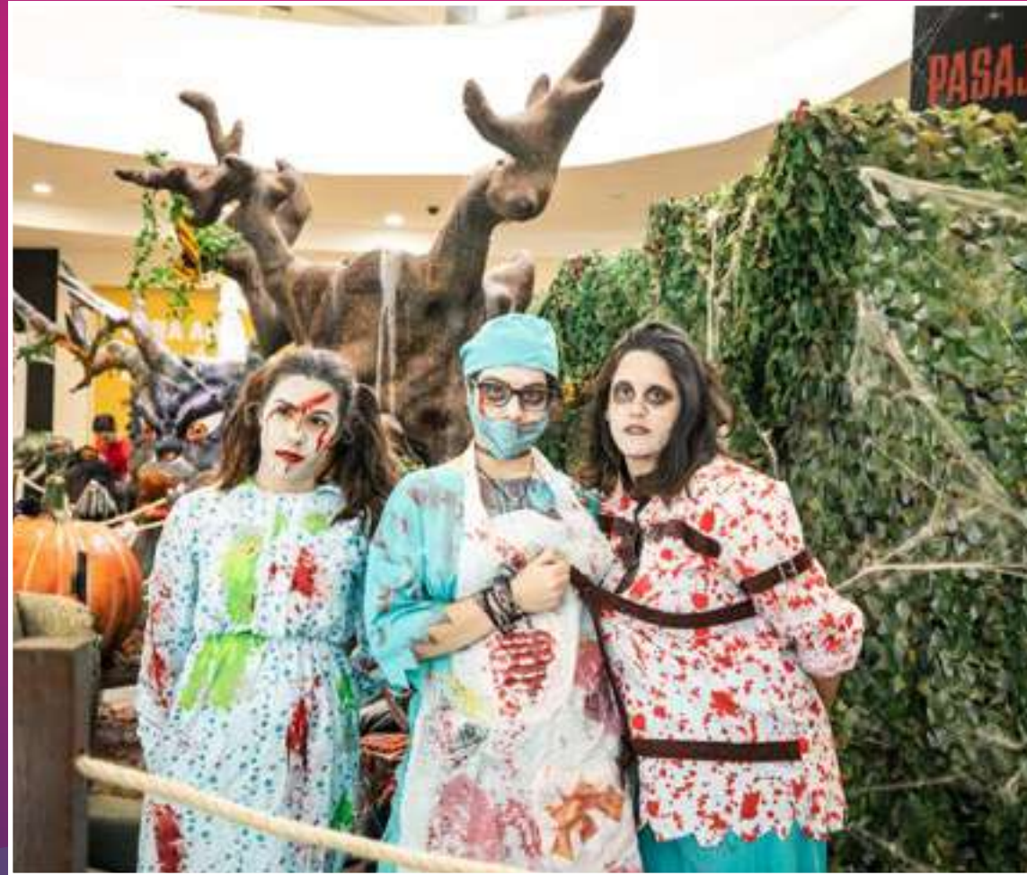
PASAJE DEL TERROR